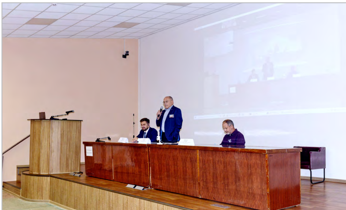
Рис. 2. Открытие конференции 27.09.2021 г.

Разработано Решение, которое опубликовано в Сборнике трудов конференции и на сайте Конференции по адресу http://emsd.ru/conf2021 . Очередную научно-техническую конференцию рекомендовано провести осенью 2023 года.