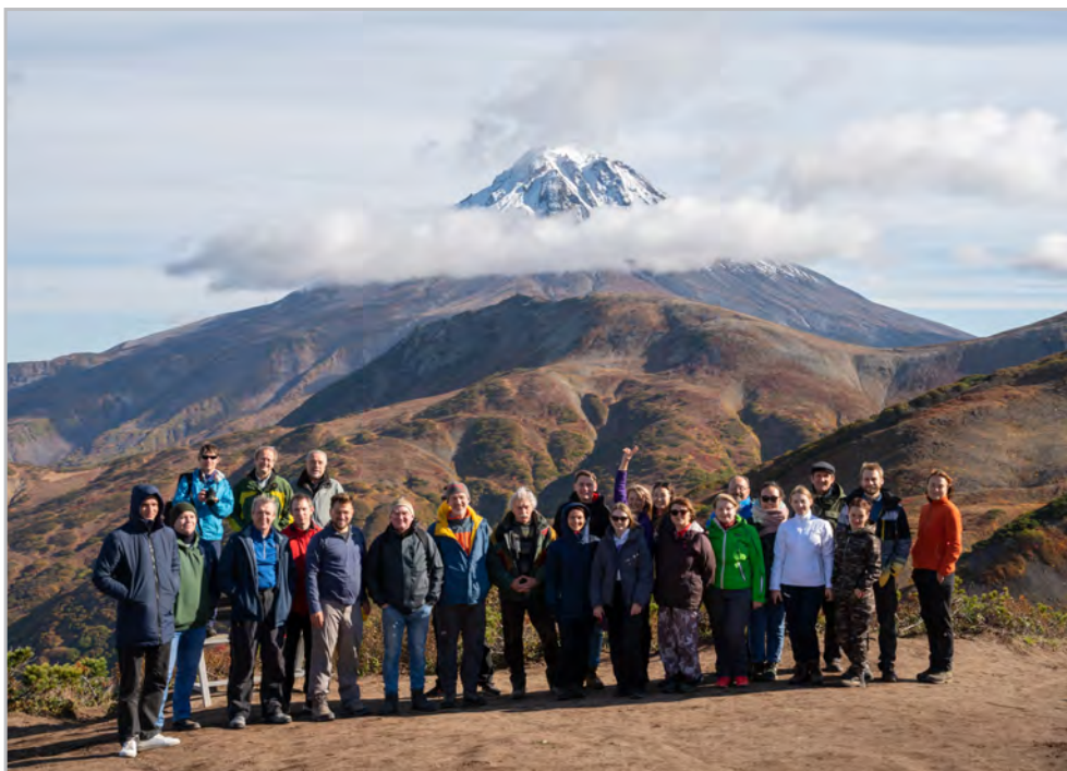
Рис. 3. Участники конференции на фоне Вилучинского вулкана 28.09.2021 г.