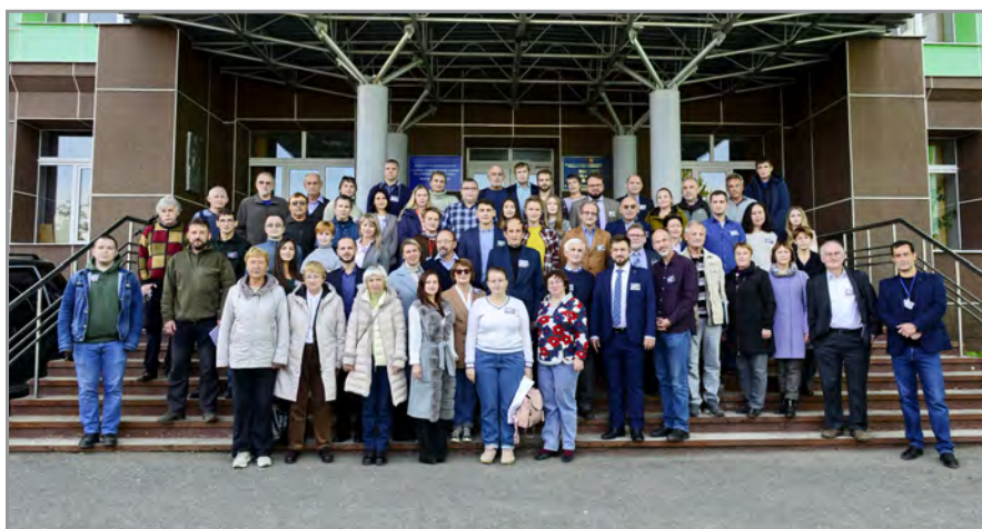
Рис. 1. Очные участники VIII Всероссийской научно-технической конференции с международным участием «Проблемы комплексного геофизического мониторинга сейсмоактивных регионов» 27.09.2021 г.

В работе Конференции приняли участие более 110 учёных из России и стран ближнего и дальнего зарубежья, в том числе 28 докторов и 44 кандидата наук (рис. 1). Представители России прибыли из Москвы, Обнинска, Апатитов, Сыктывкара, Екатеринбурга, Новосибирска, Иркутска, Красноярска, Магадана, Хабаровска, Владивостока, Южно-Сахалинска и пос. Паратунка Камчатского края. Зарубежные страны были представлены семью специалистами из Великобритании, Украины, Узбекистана, Таджикистана и Азербайджана.